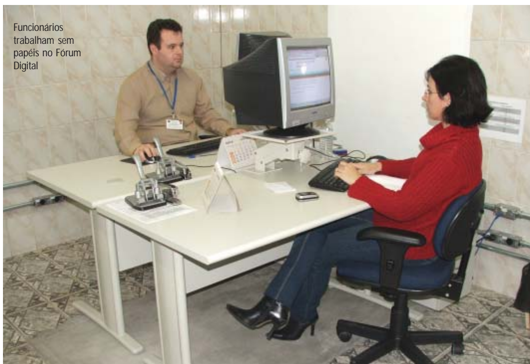
Funcionários trabalham sem papéis no Fórum Digital

tal informatização, funcionários do judiciário trabalharão com uma estrutura mais adequada, fato que contribuirá para maior produção no trabalho e até na melhoria da qualidade de vida. Esperamos que o Tribunal dê continuidade a essas melhorias”, destacou Antonio Grandi, presidente da Apatej.